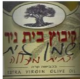
זיוף הרב יצחק אלון