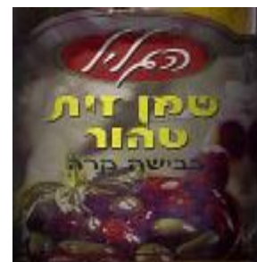
המועה "ד עמק לוד ובד"צ נחלת יצחק