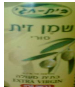
זיוף הרבנות לכשרות ארצית וחוג חת"ס