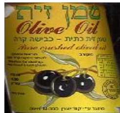
זיוף רבנות חיפה