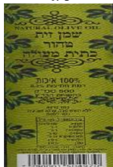
זיוף בד"ץ העדה החרדית י"ם