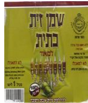
זיוף רבנות מרום הגליל ויורה דעה