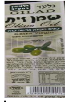
רבנות לכשרות ארצית וחוג חת"ס פ"ת