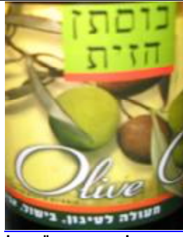
הרב מעטוף חבל מודיעין ובד"צ נחלת יצחק