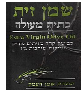
זיוף ה"רבנות לכשרות ארצית"