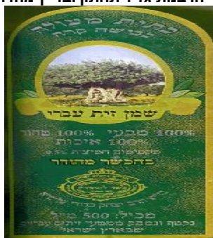
זיוף בד"צ נחלת יצחק