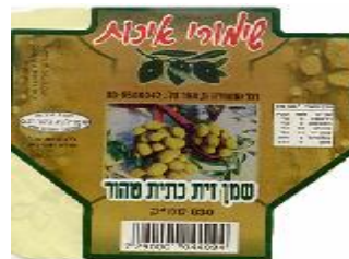
זיוף הרה"ר ר חולון