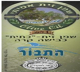
זיוף בד"ץ המכונה "נחלת יצחק"