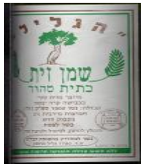
זיוף בד"ץ המכונה "קהילות היראים"