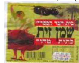
זיוף הרב משה טייר