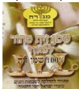
זיוף הרבנות לכשרות ארצית וחוג חת"ס