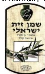
זיוף רבנות טבריא