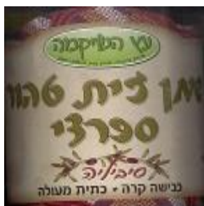
זיוף בד"ץ נחלת יצחק