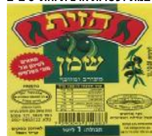
זיוף רבנות מרום הגליל ויורה דעה