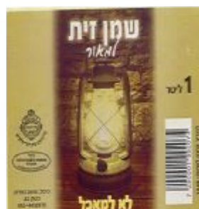
זיוף רבנות עמק לוד ובד"ץ נחלת יצחק