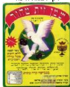
זיוף ועד הכשרות רבנות י"ם