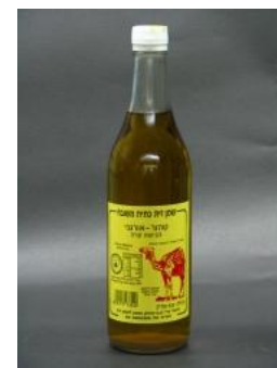
זיוף הרבנות נצרת עילית