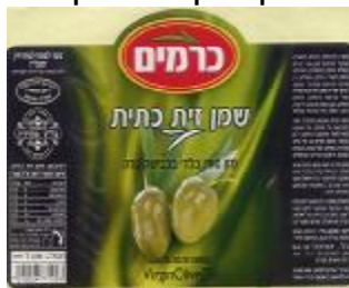
זיוף הרבנות גליל תחתון ובד"ץ מהדרין