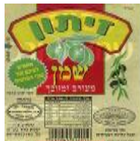
זיוף רבנות מרום הגליל ויורה דעה