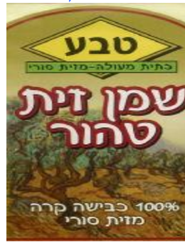
זיוף בד"ץ נחלת יצחק