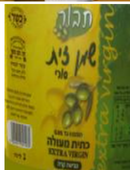
זיוף הרבנות לכשרות ארצית וחוג חת"ס פ"ת