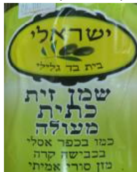
יורה דעה ורבנות לכשרות ארצית