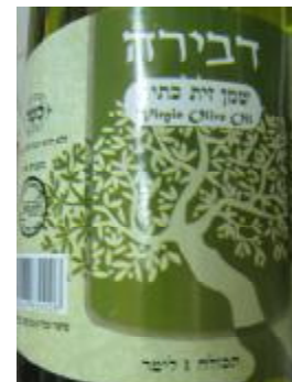
רבנות לכשרות ארצית וחת"ס ב"ב