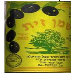
זיוף רבנות זכרון עקב