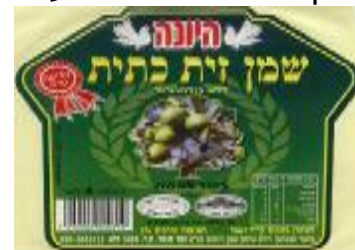
זיוף רבנות מרום הגליל ויורה דעה