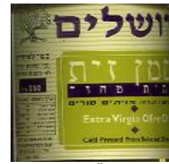
זיוף בד"ץ נוה ציון