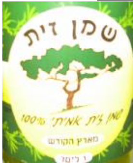
הרב חיים נבון מושב שזור