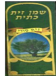
זיוף הרב משה טייר