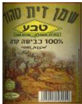
זיוף רבנות עמק לוד ובד"ץ נחלת יצחק