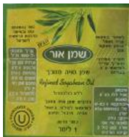
זיוף הרה"ר ישראל זה - או יו