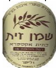
זיוף הרה"ר לישראל