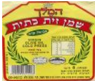
רבנות מרום הגליל ובד"צ יורה דעה הפסיקו לתת כשרות לייצרן זה