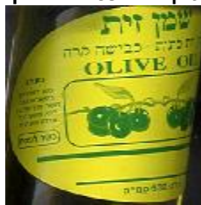
זיוף הרב משה פרץ