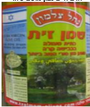
בד"צ נחלת יצחק